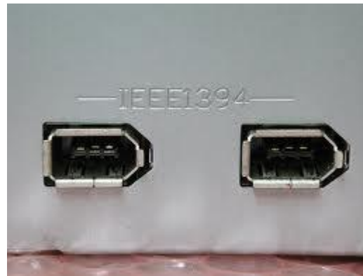
I vari formati