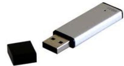
Una Flash Drive